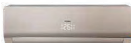
Кондиционер с панелью и корпусом цвета ЗОЛОТО (Только для моделей 12К, 18К)