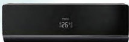
Кондиционер с панелью и корпусом чёрного цвета