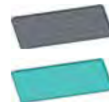
Фотокаталитический фильтр / Антибактериальный фильтр