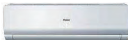
Кондиционер с панелью белого цвета и корпусом белого цвета