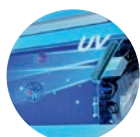
УФ лампа (LED)