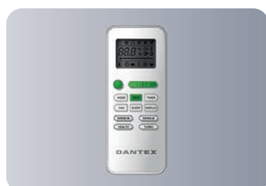
Функциональный пульт ДУ GYKQ-52E